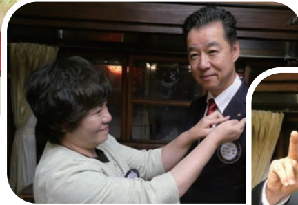
△新旧会長・幹事バッジ交換